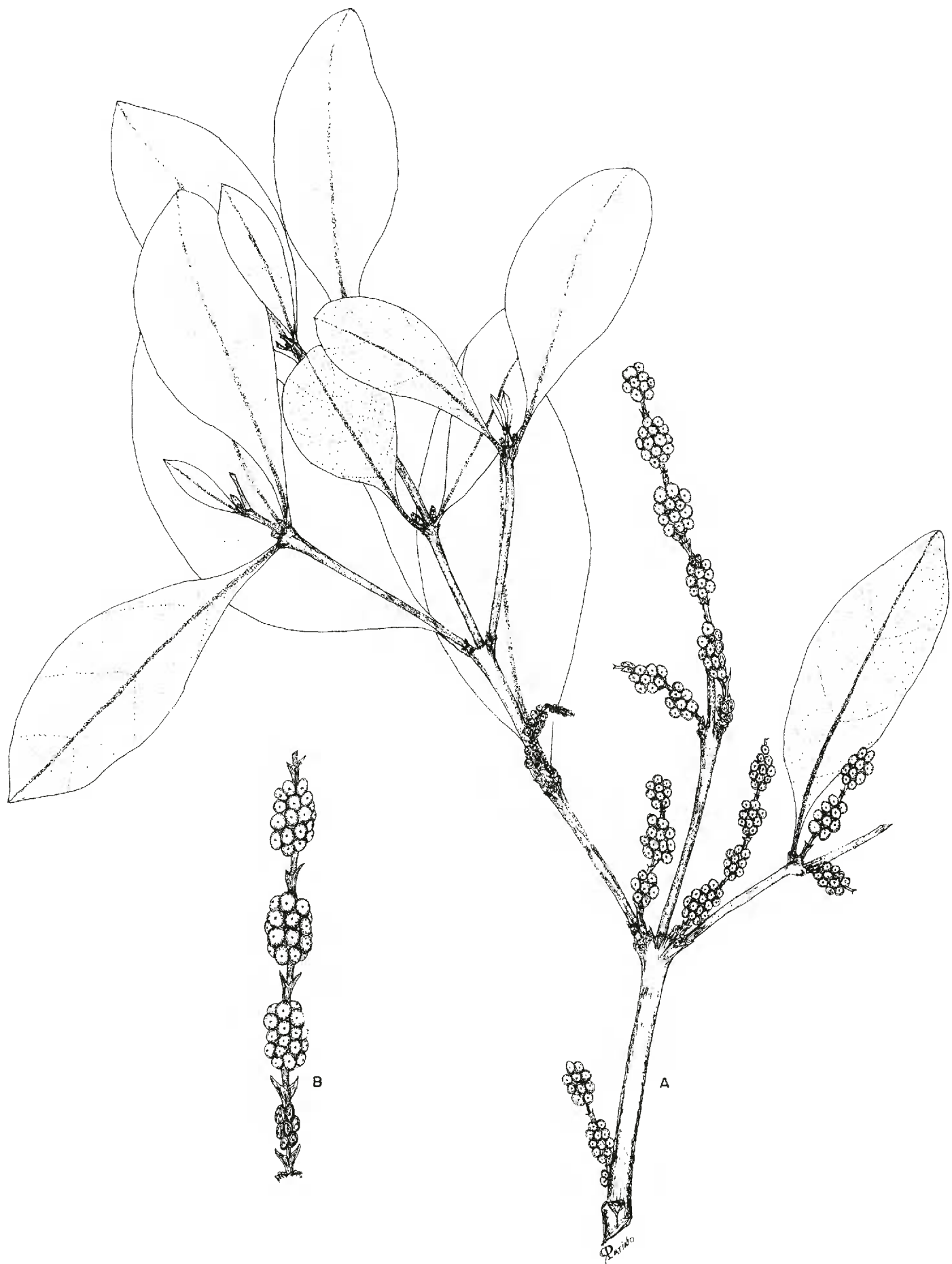
Fig. 1. Phoradendron oliverianum Trel. A. Rama con infrutescencias; B. Infrutescencias (P. Tenorio L. et al. 13925, MICH Y MEXU).